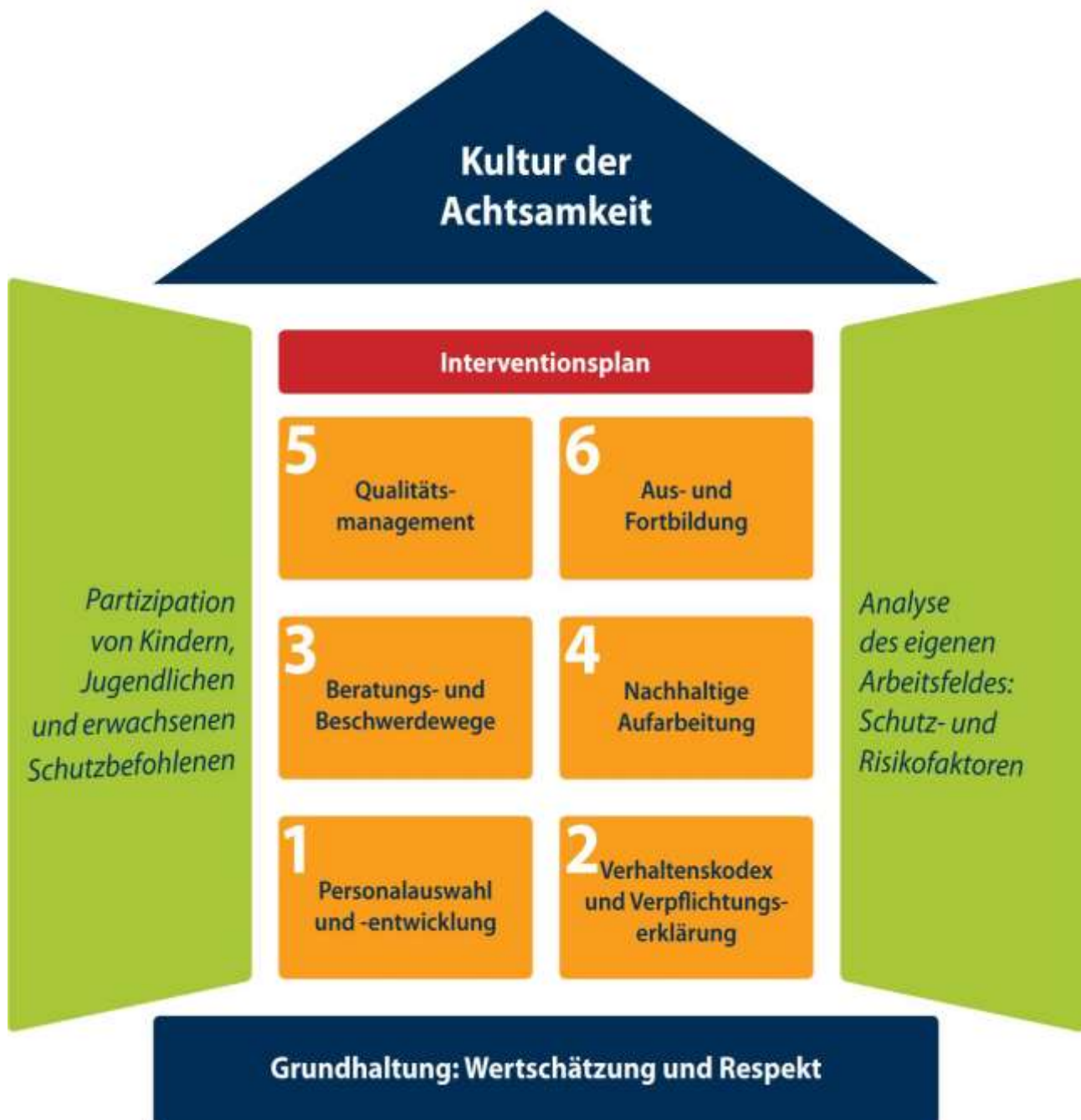
Abbildung: Fachstelle Kinder- und Jugendschutz, Bischöfliches Generalvikariat Trier

Die Themen, die im Schutzkonzept behandelt werden, sind im „Haus der Prävention“ übersichtlich abgebildet: